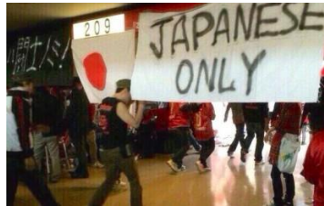
הבאנר JAPANESE ONLY במרץ של השנה שעברה

מקרי אלימות וביטויים של גזענות עדיין נדירים באולמות הכדורגל ביפן. במאי 2008 התרחשה קטטה אלימה בין שני מחנות אולטרס של קבוצות יריבות (אוראוה רד'ס שמייצגת את מחוז סאיטמה במזרח יפן וגמבה אוסאקה). הפרשה הכתה גלים בעיתונות והקבוצות נקנסו בחומרה רבה. מאורע שני התרחש מוקדם יותר השנה כאשר חברים בארגון האולטרס של הרד'ס תלו באצטדיון כרזה שעליה נכתב "Japanese Only". הדעה הרווחת היא כי בכך האוהדים התכוונו להביע חוסר סובלנות כלפי זרים באצטדיון. גם פרשה זו זכתה לגינויים מקיר לקיר ונשיא הקבוצה, מיטסונורי פוג'יגוצ', התנצל בפומבי. ארגון האולטרס של הקבוצה פורק לבסוף.