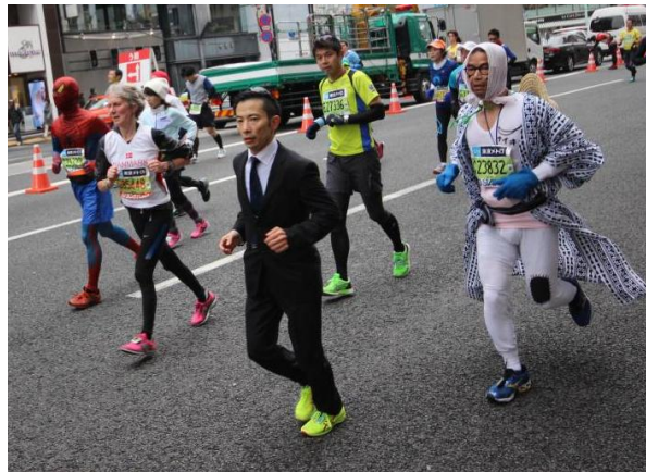
מרתון טוקיו שהתקיים ב- 22 בפברואר