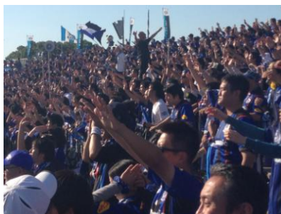
אוהדי גמבה בפעולה

ענף הספורט הוותיק והפופולארי ביותר ביפן הוא הבייסבול, ומאות אלפי יפנים נוהרים מידי שבוע למגרשים לצפות בחבטות ובהקפות של השחקנים על המגרש. הבייסבול הגיע ליפן מארה"ב בסוף המאה ה-19 והמשיך להיות פופולארי גם בזמן הקרבות הסוערים ביותר בין יפן לארה"ב במלחמת העולם השנייה. בשנות ה-80, בזמן שהכלכלה היפנית שגשגה, קבוצות הבייסבול היפניות רכשו שחקנים אמריקאים מובילים שישחקו בשורותיהן.