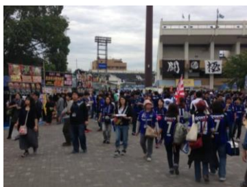
פיקניק ביום המשחק. משפחות עם ילדים, תלמידי תיכון ואנשים שסתם באים לבלות את אחה"צ במגרש

במקביל, בכדי להגביר את האטרקטיביות של הליגה, הוצעו חוזי עתק לכוכבים אירופאים ודרום אמריקאים מפורסמים שהיו לקראת פרישה, וכך הגיעו ל J-LEAGUE שמות גדולים כמו: זיקו הברזילאי האגדי (שלימים אף מונה למאמן נבחרת יפן) ו-ארסן וונגר, המאמן הצרפתי הלא פחות אגדי. פרויקט הטמעת הכדורגל בקהילה והפיכתו לענף ספורט פופולרי הוכתר בהצלחה לא רק בשל ששת מיליון הצופים שפקדו את האצטדיונים ב-1995, ובשל העובדה כי למעלה מחמישים אחוז מהאוהדים במגרשים הן נשים, אלא בעיקר בגלל שעד היום, חוצותיהם של האצטדיונים ביום של משחק נראים כמו הפנינג ענק; אלפי משפחות וקבוצות של חברים אוכלים יחדיו, שותים ונהנים מאירוע חברתי נעים.