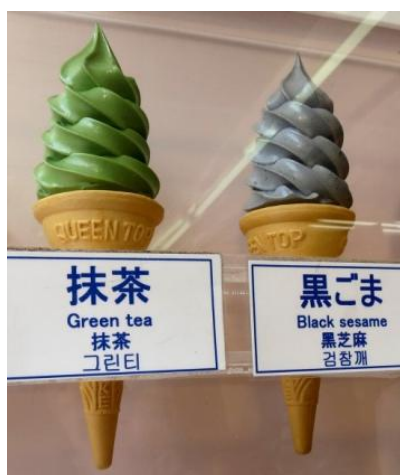
הצעה לימי הקיץ החמים: גלידת תה ירוק (מאצ'ה) או גלידת שומשום מלא (קורו-גומה)