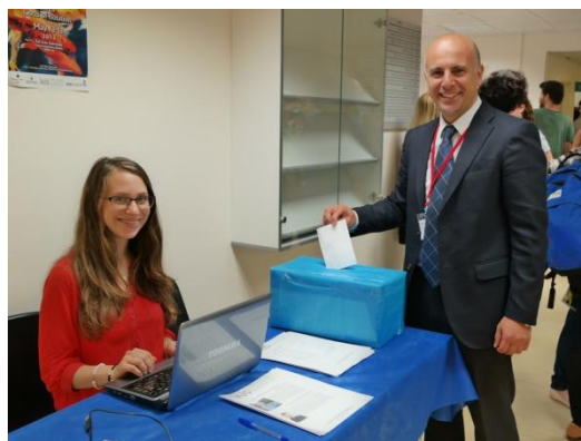
דר' ניסים אוטמזגין, יו"ר איל"י היוצא, מצביע בבחירות לאגודה

◀ אנו מאחלים הצלחה מרובה לנבחרים בתפקידם!!